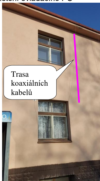
Obr. 4 Trasa po fasádě