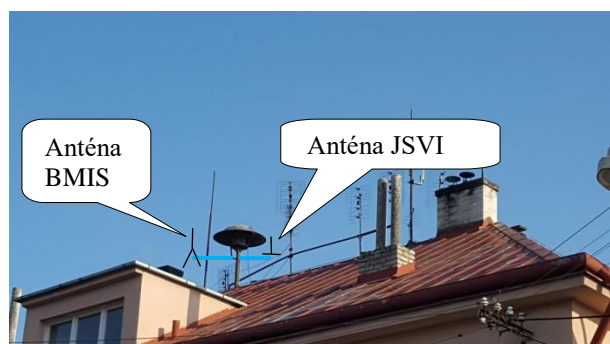
Obr. 5 Umístění antén