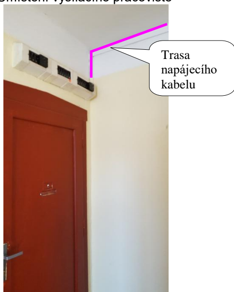
Obr. 3 Jističe