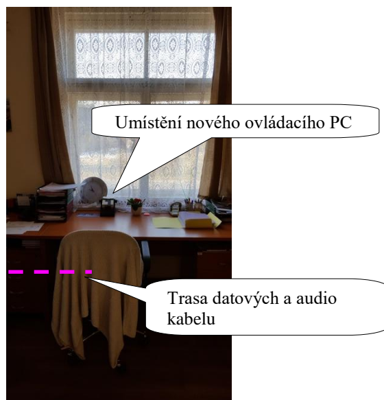
Obr. 2 Umístění ovládacího PC